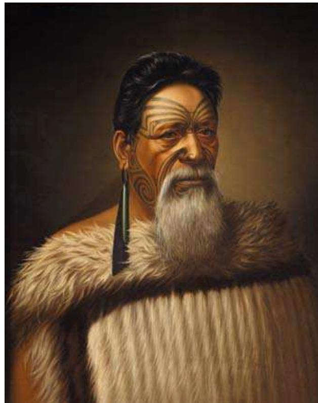
GOTTFRIED LINDAUER, HON. WI TAKO NGATATA, M.L.C., CHIEF OF THE NGATIWA TRIBE IN TARANAKI N.Z., 1880, ÖL AUF LEINWAND OIL ON CANVAS, 66 x 53,3 CM MUSEUM OF NEW ZEALAND TE PAPA TONGAREWA, GESCHENK VON GIFT OF ALEXANDER TURNBULL, 1916

The symposium is devoted to the questions concerning such art’s inclusion or exclusion. Its focus falls, therefore, on considering the role of museums as institutions for laying down canons. We intend to take account of colonial history and the processes of globalisation concomitant on it in the nineteenth century, in order to promote discussion of